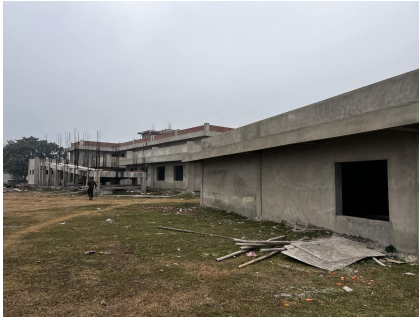
लेखापरीक्षणको अवधिसम्मको भौतिक प्रगती

ठेक्काको म्याद थप: सार्वजनिक खरिद ऐन २०६३ को दफा ५६ मा खरिद सम्झौतामा उल्लेख भए अनुसार खरिद सम्झौताको म्याद थप गर्ने उल्लेख छ । नियमावलीको नियम १२८ मा खरिद तथा निर्माणको सम्झौता गर्नेले सम्झौता बमोजिम काम शुरु नगरेमा, काम शुरु गरी बीचमै छोडेमा वा सम्झौता बमोजिम प्रगति नगरेमा सार्वजनिक निकायले त्यस्तो सम्झौता जुनसुकै बखत अन्त्य गर्न सक्ने र त्यसरी सम्झौता अन्त्य भएमा पेशकी र कार्य सम्पादन जमानी प्राप्त गर्ने, १० प्रतिशत सम्म पूर्वनिर्धारित क्षतिपूर्ति लगाउने, बाँकी काम सम्झौता गर्नेको लागतबाट पुरा गराउने र कालोसूचीमा राख्न लेखी पठाउने व्यवस्थाहरू छन् । निर्माण व्यावसायीले सम्झौताको अवधिमा कार्य सम्पन्न गर्न नसकेकोमा प्रथम पटक कार्यापालिकाको निर्यणले कार्य तालिका पेश नगराई २०८१ चैत्र मसान्तसम्म म्याद थपेकोमा लेखापरीक्षण अवधिसम्म कार्यसम्पन्न गर्नुपर्ने म्याद २ महिना देखिएकोमा पालिकाले २०८०।८।१ सम्म तेस्रो विलसम्म रु ४१२०८६६७।८६ कार्य मूल्याङ्कन अर्थात सम्झौता रकमको ३२.९० प्रतिशत मात्र प्रगति भएकोमा लेखापरीक्षण अवधिसम्म चौथो विलसम्मको कुल रु ६०१२५७७८ अर्थात ४८.०१ प्रतिशत मात्र बित्तिय प्रगति देखिन्छ।पालिकाले हाल साइडमा काम भइरहेको जनाएता पनि कार्य प्रगति न्यून भएकोमा थप भएको म्यादमा कार्य सम्पन्न नभएमा नियमावलीको नियम १२१ अनुसार अधिकतम १० प्रतिशत पुर्वनिर्धारित क्षतिपूर्ति रकम असुल तथा निजको नाममा रहेको पेशकी रकम रु १४४६५०१२( २०८१।१।१३ को चौथो बिल को रु ७०७८८२३ कट्टी गर्दा) बाँकी रहेकोले उक्त पेशकी बैंक जमानत वा मूल्याङ्कन विलबाट कट्टी गरी पेशकी फर्स्यौट गर्नुपर्ने रु